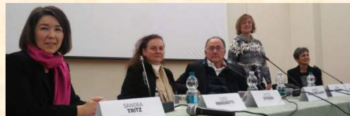
Convegno sulla Riforma am 24.11.2017

Seit vielen Jahren ist der Gottesdienst in der Mitte der Woche zur Einheit der Christen ein fester Bestandteil derselben und immer sehr gut besucht. Sowohl durch teilnehmende ranghohe Vertreter der anderen Gemeinden als auch durch Freunde im gesamten italienischen Umfeld, die den Kirchoraum füllen wie sonst nur zu Weihnachten. Beim anschliessenden Rinfresco ist immer Gelegenheit für gute Gespräche und Vertiefung der Freundschaften.